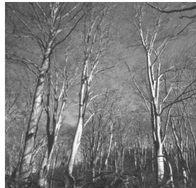
信越トレイルのブナ林。神秘的な雰囲気が

地域おこし協力隊facebook(フェイスブック) https://www.facebook.com/teshikagachiikiokoshi/