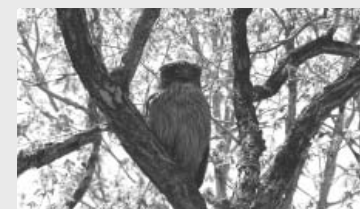
カムイとして崇めたシマフクロウ

アイヌの人たちが最も格の高いカムイ(神)として崇めたシマフクロウは、アイヌ語で「コタンコロカムイ(集落の守り神)」。夜も目を光らせ、時に低重音の声を響かせ、村を見守ってくれる存在でした。魚類が主食で、魚が捕りやすい緩流な川と営巣できる大木を抱えた森が近くにある場所というのは、アイヌの人たちの生活地と重なります。阿寒摩周国立公園が、シマフクロウにとっても人間にとっても暮らしやすいところであり続けますように。