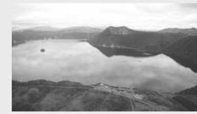
この景色を最大限に楽しんでもらうために

阿寒摩周国立公園に、おける満喫プロジェクトが、いよいよ計画から施行へと進み始めています。本国立公園に誘うための案内表示の設置、プロモーションビデオの制作、老朽化したキャンプ場などの利用施設の改修など、本公園に訪れた皆さんに満足してもらいたいという思いを込めて、取り組みを進めています。