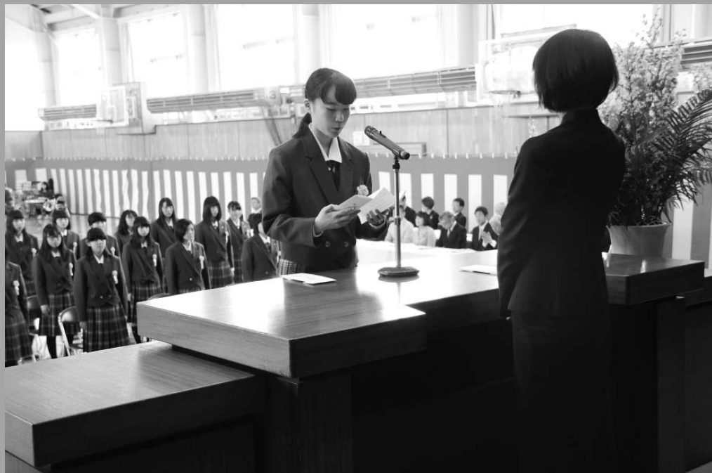
新入生宣誓(4/9弟子屈高校)