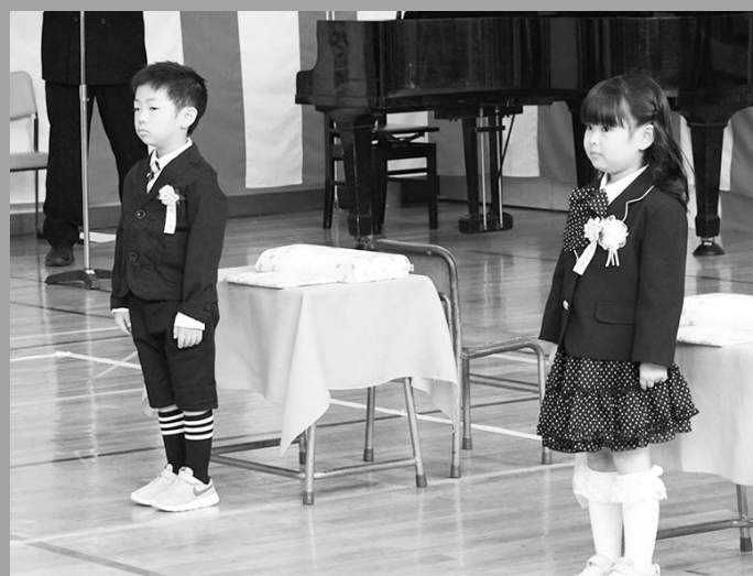
少し緊張気味?(4/6 奥春別小学校)