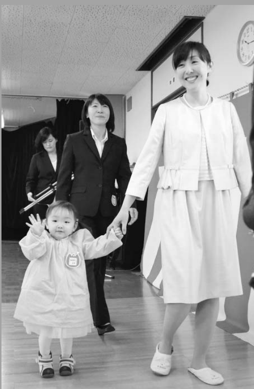
お母さんに手を引かれ教室へ(4/8 摩周丘幼稚園)