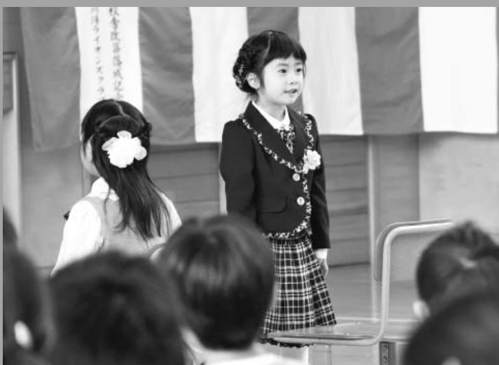
名前を呼ばれ、在校生にご挨拶(4/6 川湯小学校)