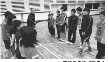
昨年の少年団交流会