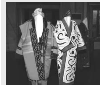
アイヌ民族の衣装を着てみませんか

アイヌ文化について学べる施設として地域にゆかりのある資料の展示のほか、刺しゅう体験や民族衣装の試着体験も行えます。今年松浦武四郎本町来訪160周年を記念し、5月中は皆さん団体料金で入館でき、更に無料入館日も設定しておりますのでぜひご来館ください。