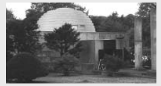
ぜひご来館ください