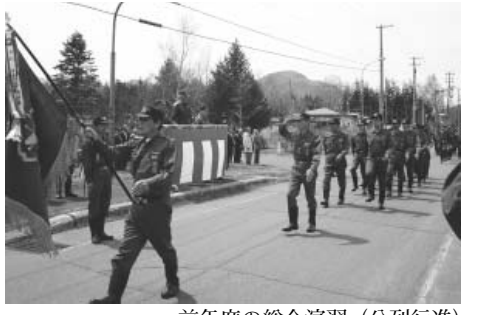
前年度の総合演習(分列行進)