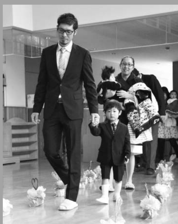
お父さん、お母さんと一緒に入場(4/4 おひさま保育園)