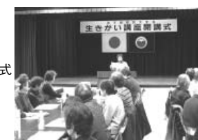
弟子屈学級の開講式