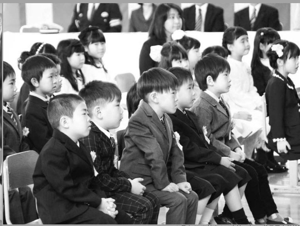
お兄さん、お姉さんの表情に(4/6 弟子屈小学校)