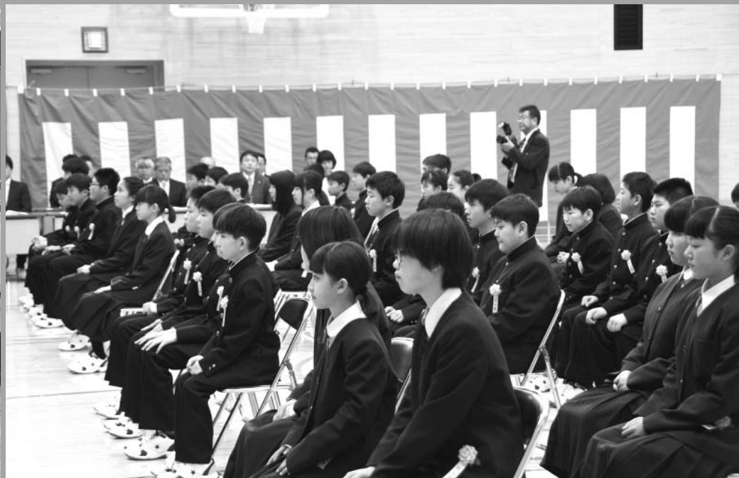
真新しい制服に身を包み(4/6 弟子屈中学校)