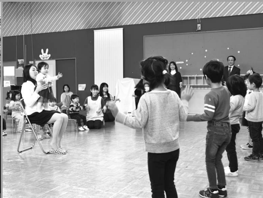
新入園児へお兄さん、お姉さんから歌のプレゼント(4/3 川湯保育園)