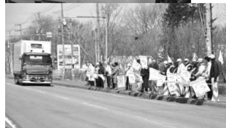
ドライバーに注意を促す

当日は自治会や関係団体などからおよそ80人が参加。参加者の皆さんは安全旗を手に沿道に並び、行き交うドライバーに交通安全を呼びかけました。また、文化センター駐車帯へ数台を誘導し、弟子屈警察署や町女性ドライバーズクラブの皆さんがドライバーに直接声をかけ、交通安全を呼びかけるパンフレットや啓発品を手渡しました。