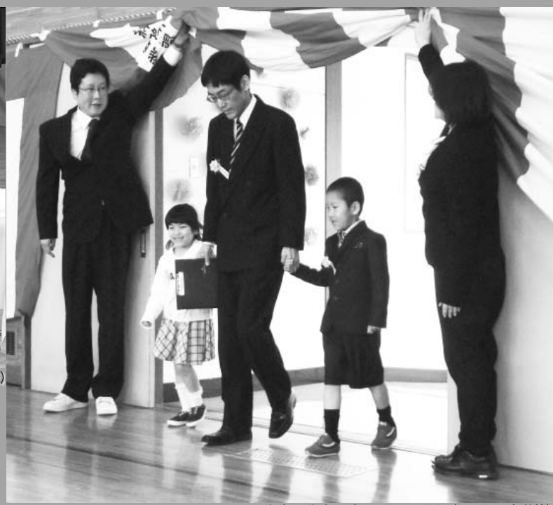
担任の先生と手をつないで入場(4/6 和琴小学校)