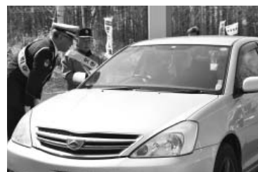
啓発品を手渡し呼びかけ