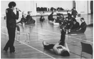
昨年のコンディショニング教室