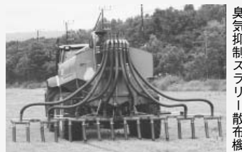
臭気抑制スラリー散布機

☐ 問い合わせ先/弟子屈町家畜ふん尿臭気・再生可能エネルギー対策協議会(事務局/役場農林課農政係 ☎ 4 8 2 - 2 9 3 6 (課直通)まで。