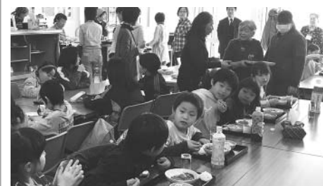
たくさん子どもたちでにぎわいました

この取り組みは今後も続けられ、次回6月16日(土)には、カレーライスなどを予定しています。