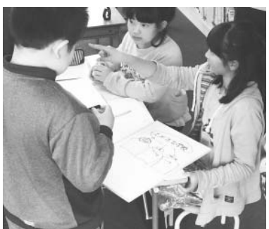
自主的にチームでの活動を

え、「楽しいこと」「協力すること」「健康なこと」が必要であるということとまとめ、「Happy(楽しい)」「Cooperation(協力)」「元気!」の三つのチームが結成されました。現在、それぞれのチームで計画を立て、「全員とあいさつ運動」や「笑顔の木」、「全校遊び集会」などの特色ある取り組みを展開しています。まだまだ課題も見られますが、従来の委員会活動に比べ、「自分たちがやらなくちゃ!」という子どもたちの主体性を感じられるようになりました。