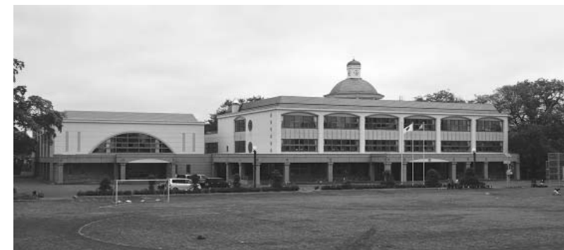
ご理解とご協力をお願いします

また、保護者からの緊急連絡対応などや、その他内容につきましては、今後、児童・生徒が在籍している各学校だよりによりお知らせします。