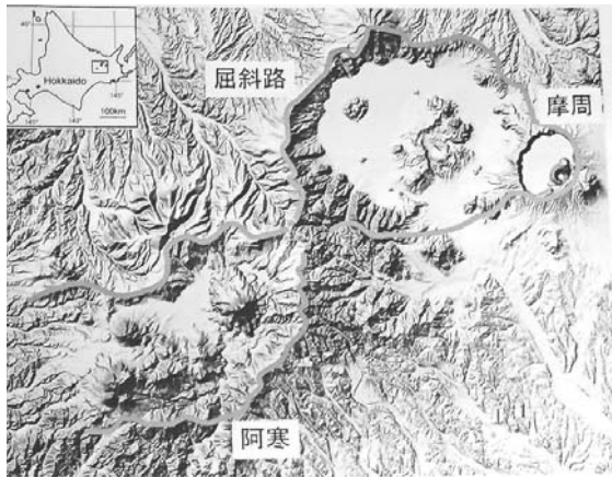
阿寒・屈斜路カルデラ火山群の位置関係

雌阿寒岳については、古くから火山防災協議会が設置されていて、大規模噴火した場合には、風向きによっては火山灰や噴石が弟子屈町にも降ってくる可能性もあります。その際には、阿寒湖畔地域の住民や観光客が阿寒横断道路を通過して、弟子屈町方向に避難して来るとも想定されています。