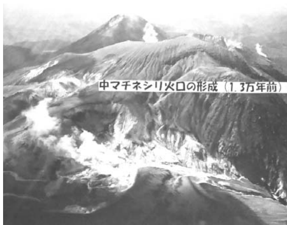
雌阿寒岳 一番奥に見えるのが阿寒富士