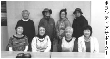
ボランティアサポーター

誰でも参加できる「弟子屈ならでの大会」として今後も継続されていくべきイベントではないでしょうか。