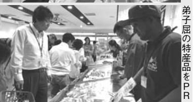
弟子屈の特産品をPR