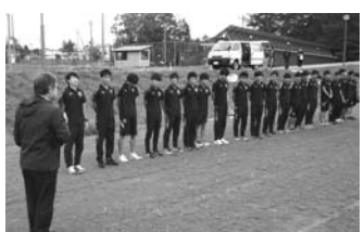
昨年の合宿の様子

今年も弟子屈町で合宿 箱根駅伝に2度出場経験のある東京国際大学駅伝部が、8月15日から20日まで、当町で合宿を行います。 今年で合宿も4年目。来年の箱根駅伝出場に向けて頑張っていますので暖かいご声援をお願いします。