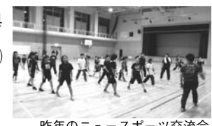
昨年のニュースポーツ交流会

(体力測定会を開催します) ▼日時/8月30日(木) 19時~20時45分 ▼場所/弟子屈小学校体育館 ▼内容/体力測定・ミニテニスなど ▼対象/町民の方 ▼申込締切日/8月24日(金) ※普段運動していない大人の方でも気軽に参加できます。 ※運動に適した服装で、上靴を用意してください。 □申し込み・問い合わせ先/町教育委員会社会教育課体育振興係 ☎482-2948 (課直通) まで。