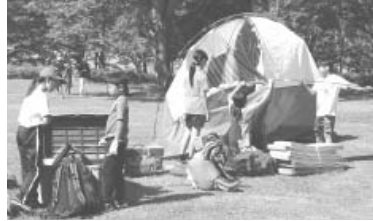
テント作りも自分たちで