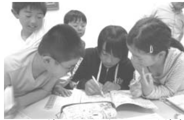
地図を見ながらコースを決定