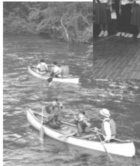
釧路川でカヌー体験(2日目)