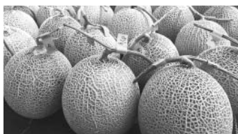
自分史上初のメロン

どの実習を行いつつ、大半の時間は栽培した品目のレポート作成をして過ごしました。写真やメモを振り返りながらの作業は、想像以上に良い復習となり、滝川と弟子屈では気候などの条件は違うながらも来年取り組むべき課題も数多く見えました。ただ、農業1年生の自分が研修先やその関係者の方々に向けてレポートを提出することは「分かったこと」「分かっている風」に書くという不思議な感覚で、なかなかハードルの高いものでした。それでも最後まで走り切れたのは、親身にサポートを続けてくださった研修先のスタッフの皆さんのおかげだと強く感じています。 今後、ようやく弟子屈で家族揃っての生活がスタートします。右も左も分からない中で北海道にやってきましたが、今ようやく、これから進むべき道が見えてきました。 町の皆さんの期待に応え、弟子屈町に根付くためにも、これから行動が大切だと思っています。少し肩ひじ張っていますが、あらためてよろしくお願います。