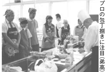
プロの包丁捌きに注目(弟高)