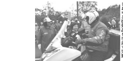
しおりと啓発品を手渡す児童