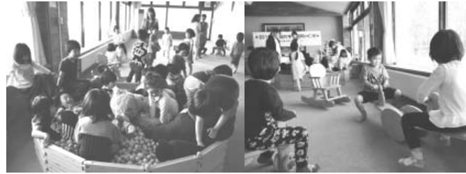
いちばん人気は木のプール