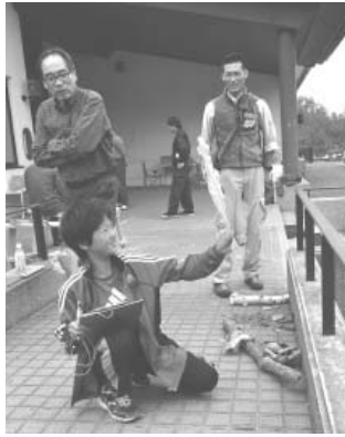
この木なんの木？目指せ樹木博士！