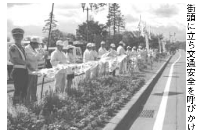
街頭に立ち交通安全を呼びかけ

10月11日には、弟子屈警察署(林隆俊署長)で、青色防犯パトロール隊研修および出発式が行われました。平成30年全国地域安全運動に向け、青色回転灯装備車を保有する「青色防犯パトロール隊」を対象に行われたもの。参加者は防犯についての講習会をしっかりと受けたあと、パトロール車へ乗り込み地域巡回に出動しました。