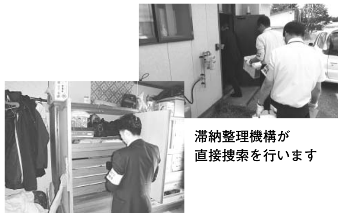
滞納整理機構が直接捜索を行います

対象者には、事前に予告書を送付し、指定された期日までに納税が無いなど、納税意思が確認できない場合には滞納整理機構へ徴収を移管することになります。