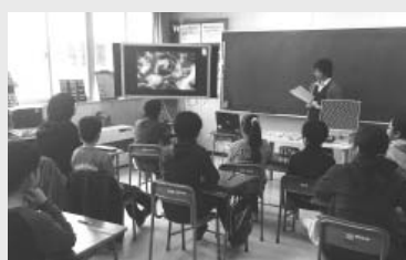
奥春別小学校での租税教室

平成30年度は、各種財産調査(延べ調査人数/預貯金505人、生命保険1,474人、給与29人など)を行い、現在、預貯金27件、給与3件、生命保険4件、捜索3件、交付要求2件の滞納処分を実施しています。(差し押さえによる換価額/562万円)