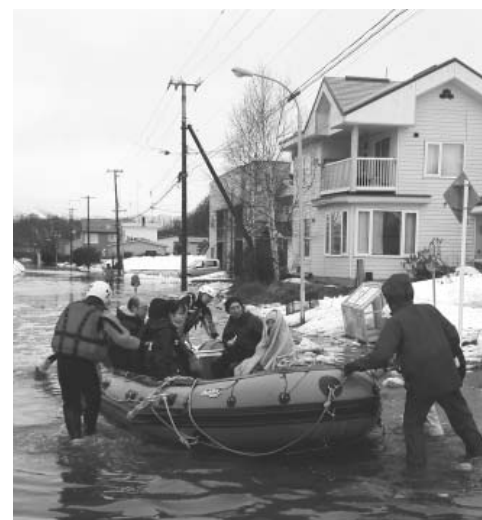
昨年3月の冠水時にボートで救出

昨年3月の記録的な大雨と気温上昇による融雪の影響で、町内の一部の地域が冠水し床上、床下浸水など、異常気象による被害が出ました。