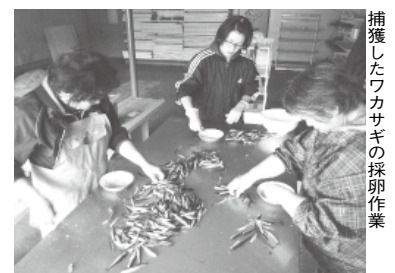
捕獲したワカサギの採卵作業