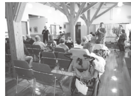
川湯の森病院では、パフォーマンスを披露