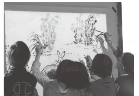
児童たちは、鳥獣戯画の制作を体験