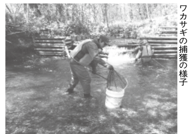
ワカサギの捕獲の様子