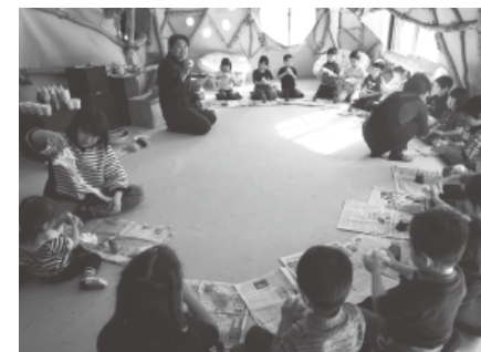
川湯保育園の園児と粘土でオブジェ作り体験

園児や児童・生徒たちは芸術文化を直に体験し、新たな驚きと楽しさを発見していました。