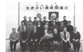
川湯学級の皆さん