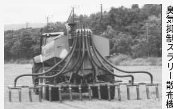
臭気抑制スラリー散布機

☐問い合わせ先／弟子屈町家畜ふん尿臭気・再生可能エネルギー対策協議会(事務局／役場農林課農政係 ☎482-2936(課直通)まで。