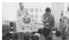
パネルシアターを楽しむ皆さん

絵本の会おはなしばらっば主催の「おはなしばらっばスペシャル」を5月11日(土)に開催しました。40人以上の幼児、小学生、親子連れの皆さんが参加され、読み聞かせ、パネルシアターを楽しみ、全員で行った工作では、皆さんに図書館30周年おめでとうと貼り絵を作成していただきました。図書館の役割側道路の窓に掲示しましたので、皆さんもぜひご覧ください!