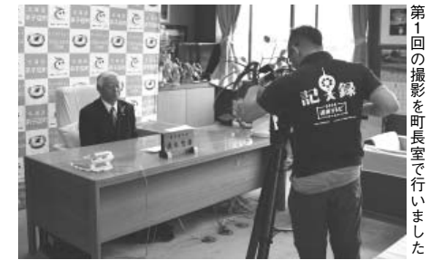
第1回の撮影を町長室で行いました

第一回は徳永町長から「町長のまちづくりへの想い」と、町に移住し、人気のお店となった「森のホール」と「cafe & bal COVO」を取り上げます。ぜひご覧ください。