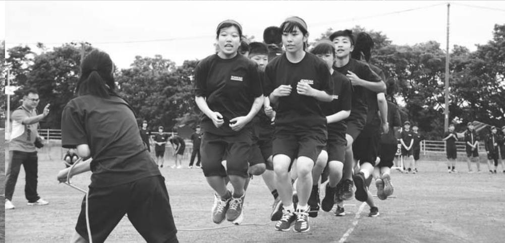
タイミングを合わせて！長縄跳び(7/21・弟子屋中学校体育祭)

6月15日から7月21日にかけて、町内各小・中学校と川湯保育園、ことま園まじゅうで、運動会・体育祭が行われました。 あいにくの雨模様となった学校もありましたが、子どもたちは元気いっぱい！お父さんやお母さんなどが見守る中、日ごろの練習の成果を発揮。各会場とも、熱い声援が飛び交いました。