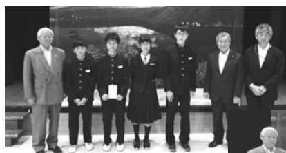
全道大会出場を決めた生徒の皆さん

小:中学生が全道大会へ! 数多くの児童・生徒が出場します! 出場選手は、次のとおりです。(敬称略)