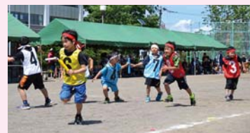
6月18日に弟子屈小学校で行われた弟子屈小学校大運動会での1コマ。この日のために練習してきた華麗なバトシリレーを見せてくれました。