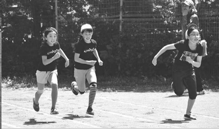
スタート！徒競走(6/18・弟子屋小学校)