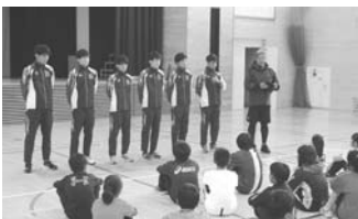
昨年の合宿中の運動教室

箱根駅伝に3度出場経験のある駅伝部が、8月15日から20日までの期間、町内で合宿を行います。今年で4年目の合宿となり、来年の箱根駅伝出場に向けて頑張っていますので温かいご声援をお願いします。