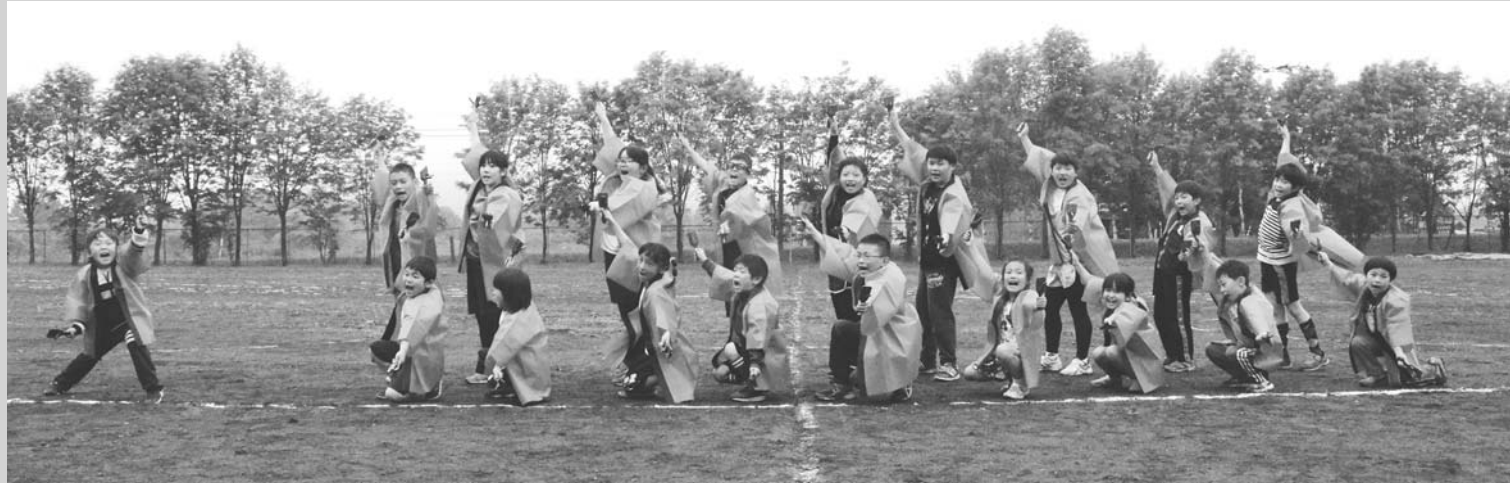
心をひとつに！よさこい2019(6/15・興春別小学校)