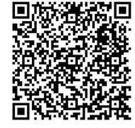
QRコードからもご確認ください

また、今年の2～4月にかけて「健診意向調査」のアンケートをお送りし、回答をいただきました。返信いただけなかった方には8月上旬にあらためて総合健診・婦人科検診の案内を送付しますので、この機会にぜひお申込みください。