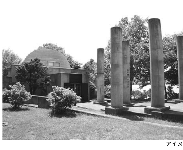
アイヌ民俗資料館の利用促進を

問 認知症などの取り組みについてモデル地区を指定し調査する 答 副町長答弁 70歳以上で介護認定を受けていない世帯への訪問調査の方法として、各地域から選出されている健康推進員や民生委員等の協力を得ながら、「モデル地区」を設定して取り組みを進める。