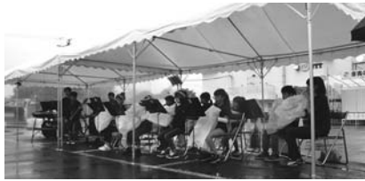
テントの中で演奏