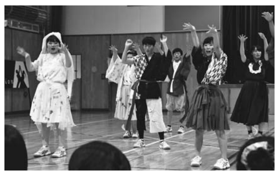
3年B組による「恐怖の館~coming soon~」