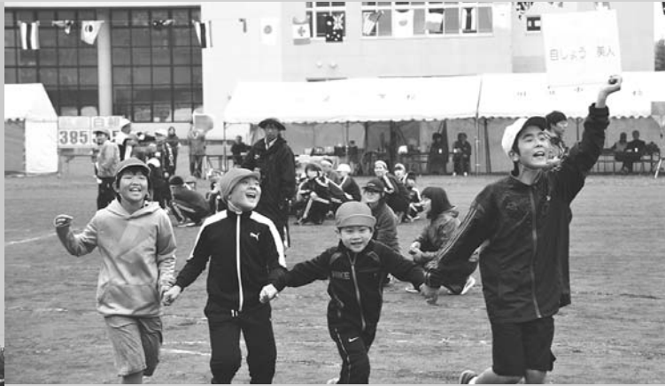
自称美人はどこに？川湯名物借り人競争(6/15・川湯コミュニティ運動会)