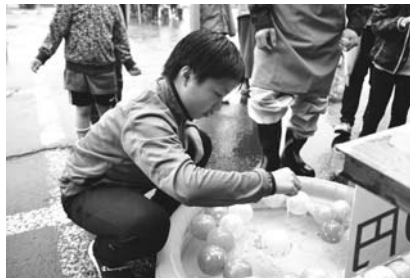
雨にも負けずヨーヨー釣りに挑戦!