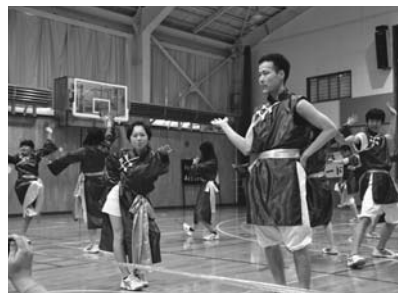
2年生による「国志无双」