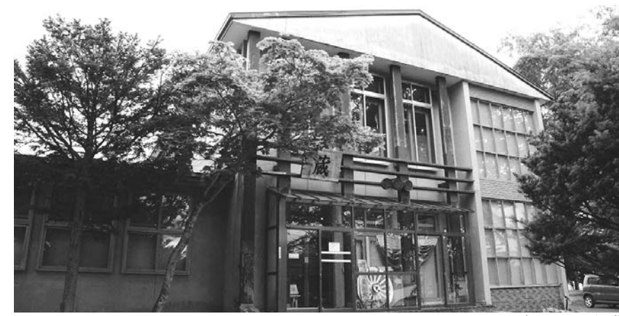
現在のてしかがの蔵

問 郷土資料収蔵庫「てしかがの蔵」について 答 文化的な価値を感じられるような利活用について検討 問 最近、地方の郷土館などで収蔵に限界がきて収蔵品や資料を手放す自治体が散見される。現在「てしかがの蔵」には約4千点の郷土資料が収蔵されているが、現況では町民の目には骨董品の倉庫としか映らないのではないかと。まず現在収蔵されている資料などがある基準を設 答 町内数か所に分散保管されていた約4千点の郷土資料を、平成19年4月に旧弟子屈営林署庁舎に移し、「弟子屈町郷土資料収蔵庫としてしかがの蔵事務所」として設置した。庁舎は昭和39年建築の木造で老朽化が著しく旧耐震基準の設計でもあり、地域の博物館としての機能を併せ持つ施設への移転を検討している。旧耐震基準の設計のため、公共施設管理計画を基に、関連施設との調整を図りながら、収蔵資料の保管スペースを備えた地域の博物館機能を併せ持つ施設への移転を検討していきたい。 また「てしかがの蔵」の収蔵品については今まで手放すことはなく、今後はその有効活用を図るため、テーマを決め公民館などで特別展の開催を検討したい。