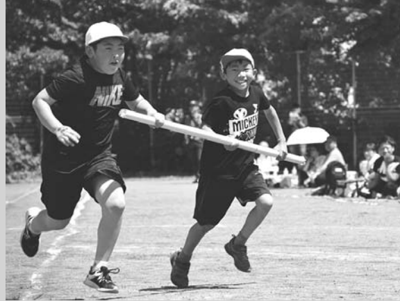
弟小ハリケーン！(6/18・弟子屋小学校)