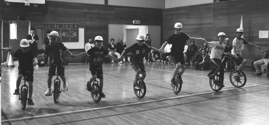
全児童による一輪車～心をひとつに～(6/16・美留和小学校)