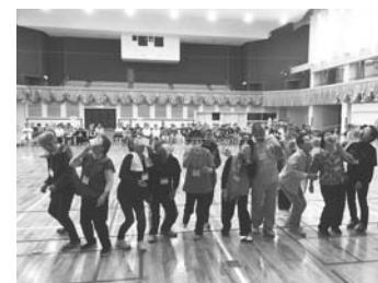
パン食い競争で大盛り上がり

7月11日、弟子屈・川湯両学級の合同室内小運動会を摩周観光文化センターで開催しました。両学級合わせて約80人が参加。4チームに分かれてピンポン玉運び、レーヤ○×クイズなど、7種目の競技を楽しみながら両学級の交流を図りました。