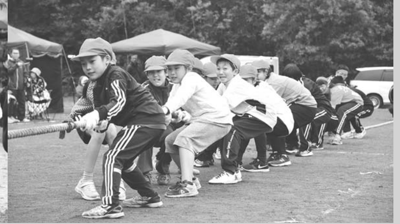
力が入る紅白綱引き(6/15・川湯コミュニティ運動会)