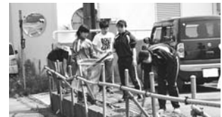
パレードコースの清掃も実施

第58回弟子屈高校文化祭が7月13日から14日にかけて開催されました。 今年のテーマは「NEON~未完成な僕らの新章開始~」。あいにくの雨となったため、予定されていたパレードは中止。夏まつり会場で披露しているアトラクションは、体育館で行われました。しかし、生徒たちの熱気はいつも以上に盛り上がりました。 その他にも、各クラスごとに趣向を凝らしたホームルームスピース、委員会や部活動の展示などが行われました。