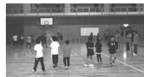
昨年のニュースポーツ交流会

(体力測定会を開催します) ▼日時/8月29日(木) 19時〜20時45分 ▼場所/弟子屈小学校体育館 ▼内容/体力測定・ミニテニスなど ▼対象/町民の方 ▼申し込み締切り日/8月23日(金) ※普段運動していない大人の方でも気軽に参加できます。 ※運動に適した服装で、上靴を用意してください。 □申し込み・問い合わせ先/町教育委員会社会教育課体育振興係 ☎482-2948 (課直通)まで。