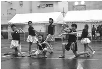
雨の中でも華麗な演技を披露