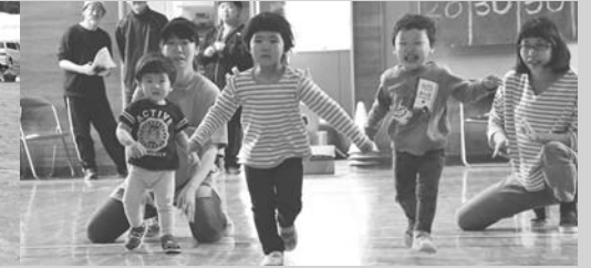
幼児競争(6/16・美留和小学校)