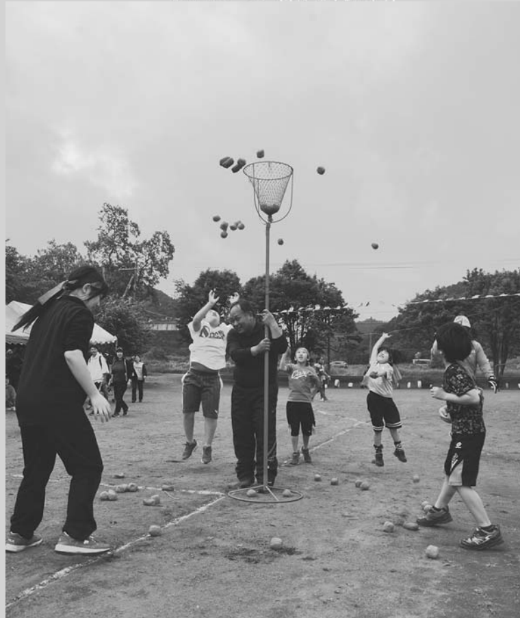
白熱した近村杭玉入れ(6/15・和琴小学校)