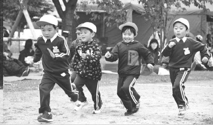
負けないぞ！かけっこ(6/29・ことま園まじゅう)