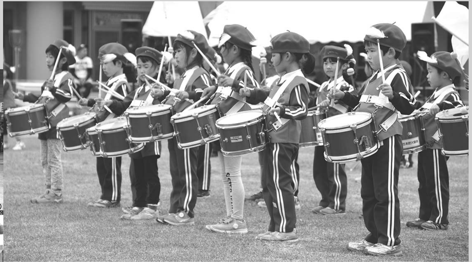
5歳児によるマーチング(6/29・ことま園まじゅう)