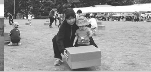
ぼくのチームは何色？(6/15・和琴小学校)