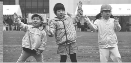
パプリカ(6/15・川湯コミュニティ運動会)