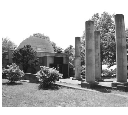
アイヌ民俗資料館の利用促進を

問 認知症などの取り組みについて モデル地区を指定し調査する 答 モデル地区を指定し調査する 2025年には、高齢者の5人に1人が認知症になると推定されている。国立長寿医療研究センターの発表では、友人と交流し地域の活動に参加するなど、社会的なつながりが多い高齢者は認知症の発症リスクが46%低下すると述べている。「早期対応・早期診断」で介