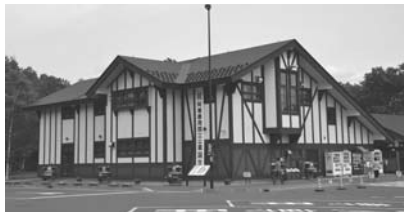
利用者に安全に利用してもらうために

答 現状では第3駐車場への誘導と誘導員や看板などの設置、駐車場の拡張について、開発との協議も含めて検討している。