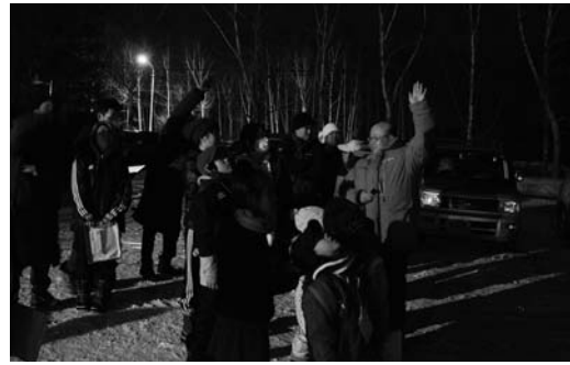
屈斜路地区で行われた星空観察会

問 第31回「星空の街・あおぞらの街」全国大会について 星空の楽しみを見直す 答 第31回「星空の街・あおぞらの街」全国大会について 星空の楽しみを見直す 本年8月3日に第31回星空の街・あおぞらの街全国大会in弟子屈町が開催される。これまでこれまで開催された各地域では星空を活かした特色のあるイベントや取り組みがなされてきたが、本町でのこの大会の捉え方、また受入れ態勢は大丈夫か。大会の趣旨を踏まえて、恵まれた自然環境などを活かし、改めて今後の観光や地域振興のはずみとなるよう、そして環境教育にも活かせるよう取り組んでいきたい。大会当日は、大樹町で民間ロケット打ち上げに關