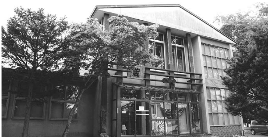
現在のてしかがの蔵

問 第31回「星空の街・あおぞらの街」全国大会について 星空の楽しみを見直す 答 第31回「星空の街・あおぞらの街」全国大会について 星空の楽しみを見直す 本年8月3日に第31回星空の街・あおぞらの街全国大会in弟子屈町が開催される。これまでこれまで開催された各地域では星空を活かした特色のあるイベントや取り組みがなされてきたが、本町でのこの大会の捉え方、また受入れ態勢は大丈夫か。大会の趣旨を踏まえて、恵まれた自然環境などを活かし、改めて今後の観光や地域振興のはずみとなるよう、そして環境教育にも活かせるよう取り組んでいきたい。大会当日は、大樹町で民間ロケット打ち上げに關