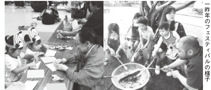
一昨年のフェスティバルの様子

大学生のお兄さんやお姉さんからの遊びのプレゼントや戸外でのおいしいプレゼントなどなど、親子で、家族で、楽しく1日を過ごしてみませんか。