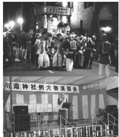
迫力のある行燈みこし川湯 演芸大会も開催川湯