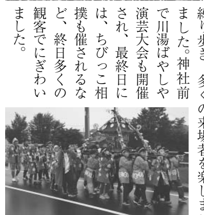
子どもみこし 弟子屈

※川湯神社例大祭演芸会のステージは、宝くじの社会貢献広報事業として、宝くじの受託事業収入を財源として実施しているコミュニティ助成事業を活用しています。