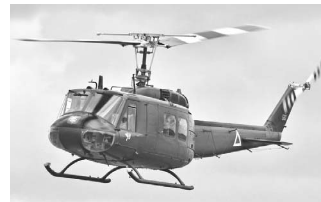
自衛隊のヘリコプターも訓練に参加