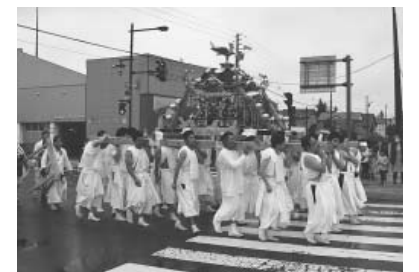
威勢のいい本みこし 弟子屈

※川湯神社例大祭演芸会のステージは、宝くじの社会貢献広報事業として、宝くじの受託事業収入を財源として実施しているコミュニティ助成事業を活用しています。