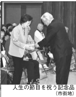
人生の節目を祝う記念品 (市街地)