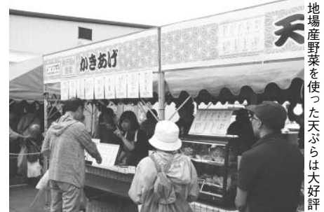
地場産野菜を使った天ぷらは大好評