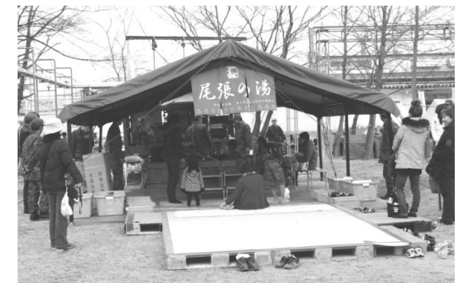
野外入浴セットも体験できます

問い合わせ先/役場総務課防災情報係 ☎ 4 8 2 - 2 9 1 2 (課直通)