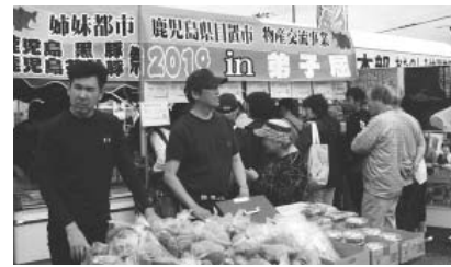
日置市の特産品を求め行列も

「摩周そば生産組合」「札幌蕎麦切会」が弟子屈産のそば粉を使った、打ちたて、ゆでたての新そばを提供し、新そばを求める方で長い列ができていました。また、摩周メロンなどの農産物即売や地場産野菜などの天ぷら販売のほか、多彩なイベントも行われ来場者を楽しませました。 同会場内では、当町と姉妹都市の鹿児島県日置市から、同市特産の黒豚や魚介類、揚げたてのさつまあげ、採れたてのサツマイモなどを販売する「鹿児島黒豚 & 茶美豚祭2019 in 弟子屈」も行われました。 日置市の特産品を求めて長い行列となり、大盛況でした。