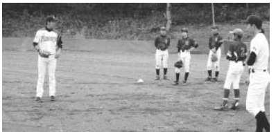
元プロ野球選手からの熱い指導も