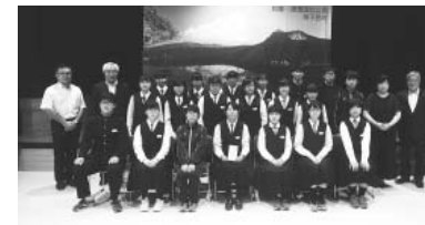
全道大会へ出場した吹奏楽部の皆さん

第56回釧路地区吹奏楽コンクールが7月27日に開催され、弟子屈中学校吹奏楽部が中学校C編成の部で金賞を受賞。30年ぶりに全道大会への出場を決めました。釧路地区の代表として8月30日に開催された第64回北海道吹奏楽コンクールでは、おしくも銅賞でしたが、30年ぶりの快挙を成し遂げた皆さんの今後の活躍が期待されます。 全道大会へ出場した吹奏楽部の皆さん