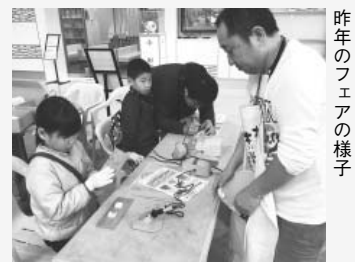
昨年のフェアの様子