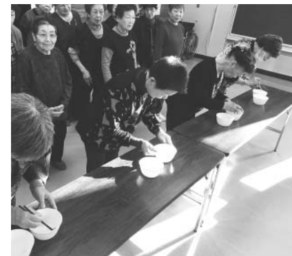
盛り上がった昨年の新年交流会(川湯)

川湯学級では12月3日、政治を学ぼうと題し議会定例会を傍聴。学級生17人が参加しました。緊張感のある議会の雰囲気を感じました。学級生らは普段中々経験ができていない議会を傍聴することができて良かったと感想を話していました。また、弟子屈学級では10日、作る楽しさと技術を学ぼうと題してコースターを作りました。いろいろな色のガラススタイルを使い、自分でデザインし素敵なコースターが出来上がりました。 ▼1月の生きがい講座/「新年の喜びを語り合おう」新年交流会 ●川湯学級/1月20日(月) 川湯農村センター ●弟子屈学級/1月22日(水) 町公民館