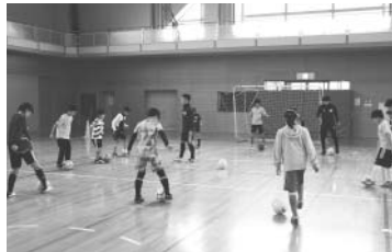
コーチの指導で基本を確認