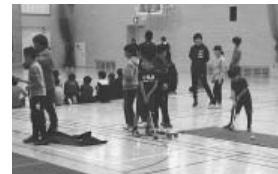
パットゴルフに挑戦

町教育委員会、弟子屈町文化・スポーツ少年団本部主催のニュースポーツ交流会が11月24日に弟子屈中学校体育館で開催されました。交流会には31人が参加。町スポーツ推進委員の指導の下、スポーツ吹矢やタグラクビー、ドッジボール、パットゴルフを体験しました。参加者は、楽しみながらニュースポーツを体験しました。