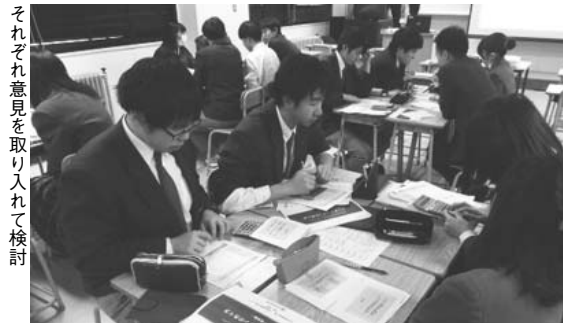
それぞれ意見を取り入れて検討