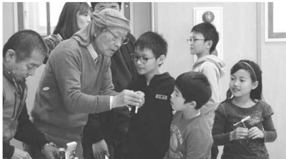
竹とんぼや割り箸鉄砲の遊び方を教えてもらう児童たち