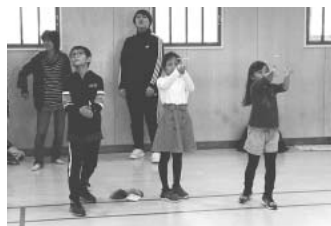
高くあがれーつと竹とんぼを飛ばす