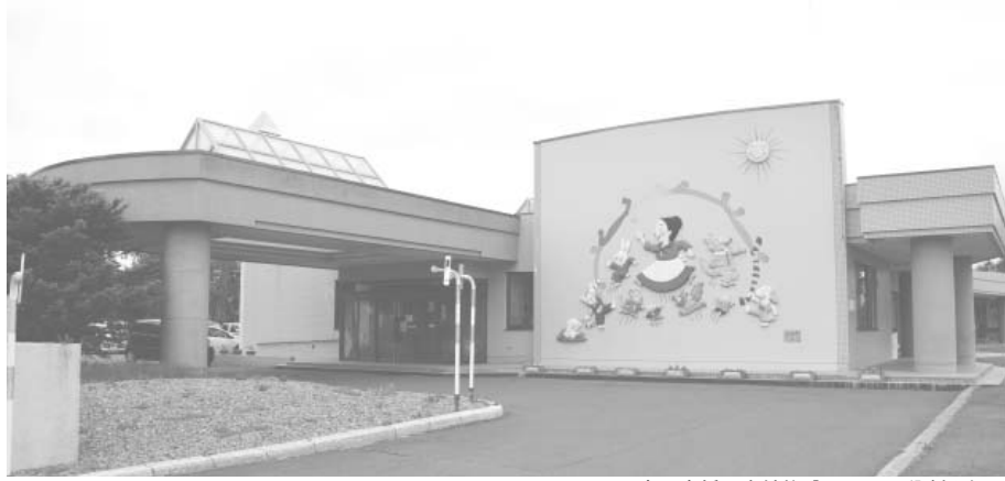
子育て支援の中核施設としての役割を担う

4月のオープンから、まだまだ試行錯誤の段階で課題も多いと思うが、認定こども園が本町における子育て支援の中核施設としての機能を発揮できるよう、また町の宝でもある子どもたちが健やかに成長できるように、できる限りの支援を行ってまいります。