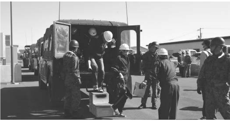
継続的な訓練や啓発を実施

本町における防災対策として、北海道の防災総合訓練のメイン会場として実施したところであるが、関係機関との連携、地域住民の防災意識向上など、大きな成果があった。今後も引き続き内容を検討した上で継続していかねければと考える。また、職員の非常招集訓練などの継続実施や備品の計画的な整備なども進めてまいり、日頃から物心両面における備えについて、行政機関のみでなく、住民の皆さんに同様の対応を意識していただく、DIG(災害図上訓練ディグ)・HUG(避難所運営訓練ハグ)を取り入れるなど、今後の訓練方法なども検討した上で、啓発にも力を入れていかなければと考える。