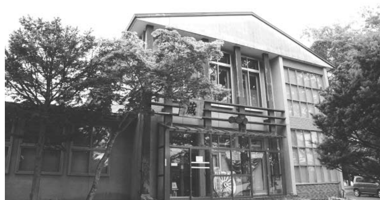
計画的な整備を進める「蔵」

問 弟子屈町は国内最大級の屈路カルデラが織りなす自然を背景に、アイヌ文化、開拓、開拓に伴う芸能など多種多様な歴史文化を持つ町である。歴史をたどる上で最も重要なのは博物史であると考えている。旧営林署跡に開設の「蔵」の所蔵品