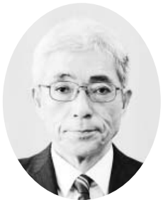
三上 務 議員 一般質問