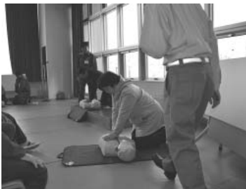
町民の皆さんと一体となった訓練を

また、今後の防災担当の人材確保についても、再任用などの経験値も生かした中で体制を組めればと考えている。