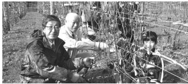
ブドウを増産し、ワイン醸造所の建設を目指す

答 近年、日本の純米酒や国産ワインスキームルト・ワインが海外から高く評価されている。中でも北海道産ワインは、空知地方ワイナリー生産のワインが世界コンクールで上位入賞するなど、品質の向上により国内外市場の拡大につながり、道内1次産業に新しいビジネスモデルとして確立しつつある。弟子屈町は平成21年よりワイナリー用ブドウ「山幸種」の試験栽培を始めてから