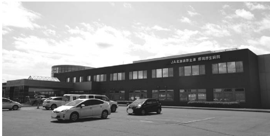
安心できる医療体制を構築

高齢化が進むので、回復期病床の20床確保に努める。摩周厚生病院は、救急医療、透析患者、介護療養型医療施設として本町の中核病院であるので、町民が安心して生活できるように町づくりを目指す。