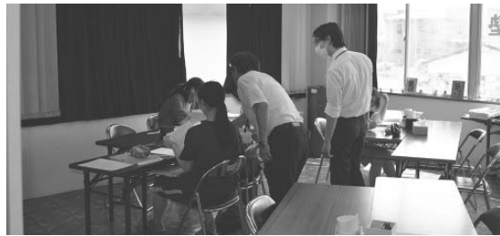
魅力ある学校づくりを目指す

長期的に維持するためには、財政負担が一番の課題になってくるが、道内の他町で活用しているアイヌ政策推進交付金なども視野に入れながら、通年型での開講の検討を進めたい。また、高校・塾・教育委員会と三者連絡会議などを組織化するとともに、中学校と高校、中学校と塾との連携も進めながら、弟子屈高校がより魅力ある高校となるよう支援していきたいと考えている。