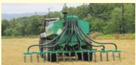
臭気抑制スラリー散布機