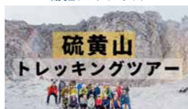
硫黄山トレッキングツアー