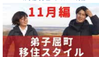
弟子屈町移住スタイル 11月編