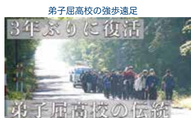
弟子屈高校の強歩遠足