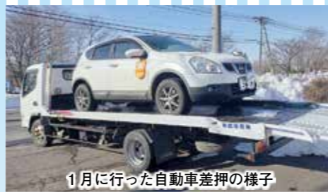
1月に行った自動車差押の様子

町では、令和4年度に123件の差押を行いました。今後もより厳しい姿勢で滞納整理に取り組みます。