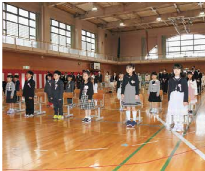
お兄さん、お姉さんの表情に(4/7弟子屈小学校)