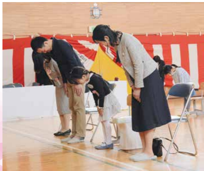
ご両親と一緒に挨拶(4/7和琴小学校)