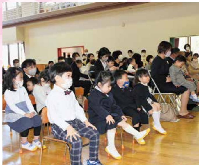
楽しんでいた入園式(4/3認定こども園ましゅう)