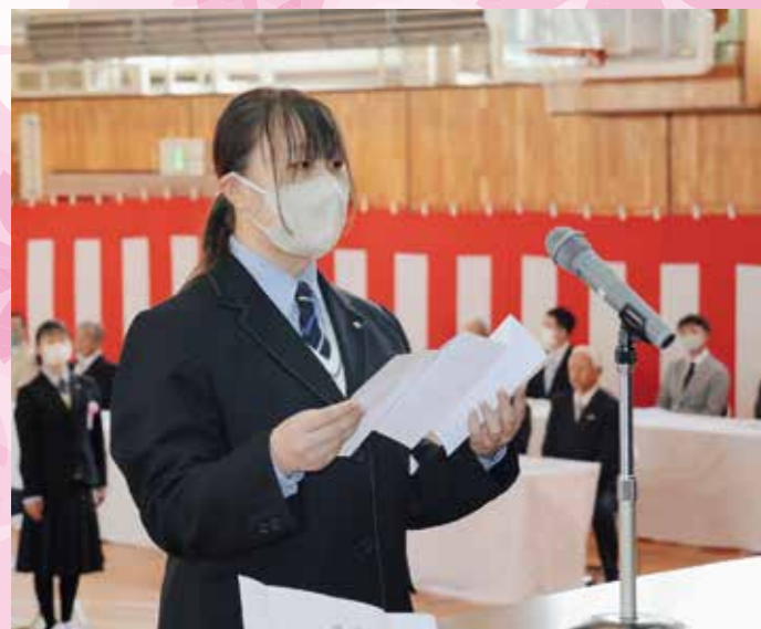
新入生を代表して校長先生に宣誓を(4/10弟子屈高校)