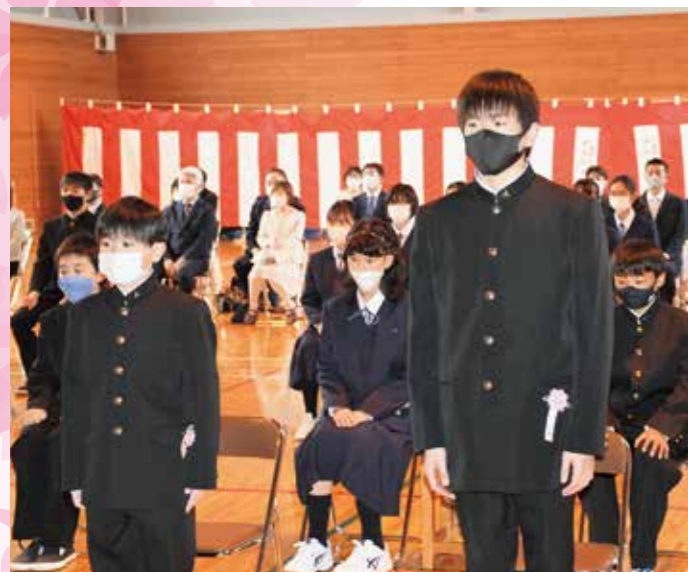
新入生呼名(4/7川湯中学校)