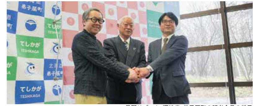
星野リゾート、環境省、弟子屈町の記者会見の様子