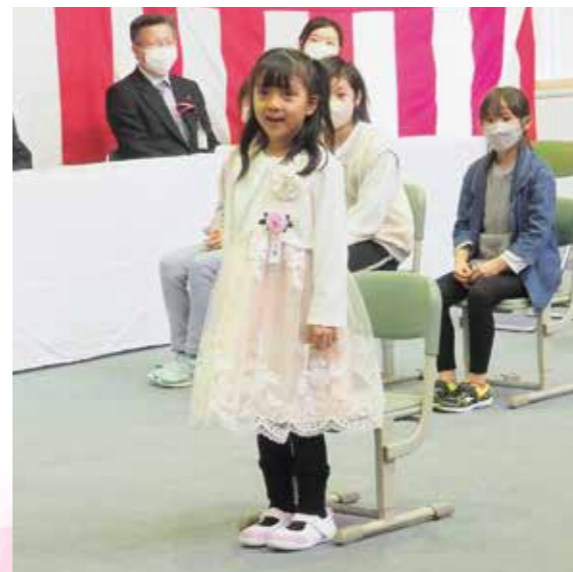
名前を呼ばれて元気にあいさつ(4/7美留和小学校)