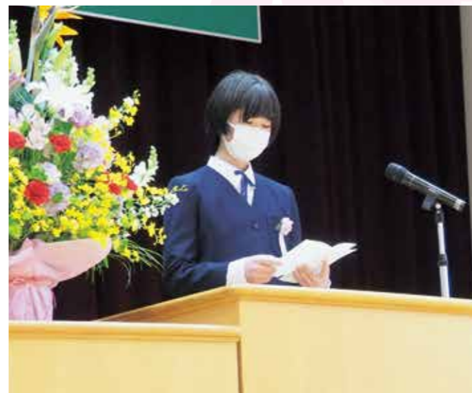
引き締まった表情で誓いの言葉を(4/7弟子屈中学校)