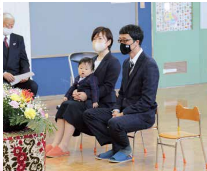
お父さん、お母さんと一緒に(4/3川湯保育園)