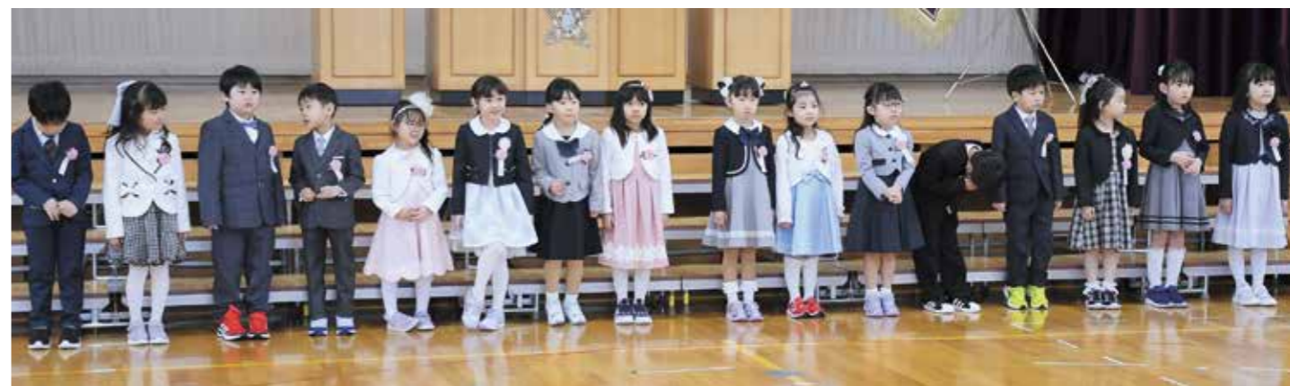
1列に整列した新一年生(4/7弟子屈小学校)