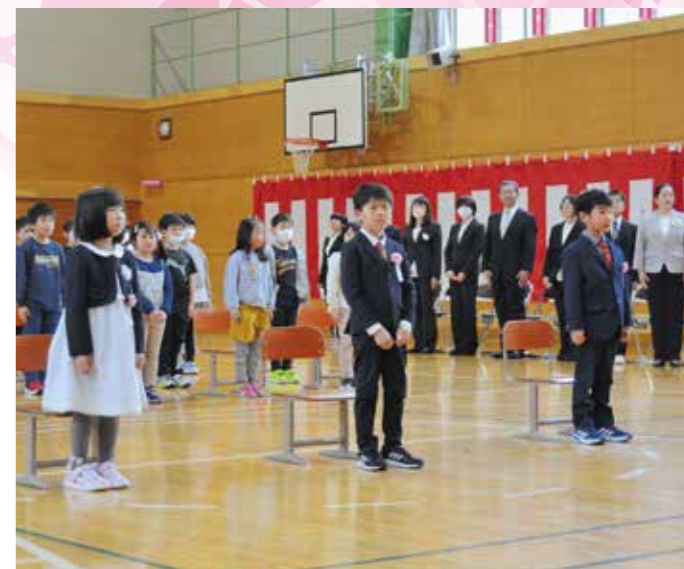
緊張した表情(4/7川湯小学校)