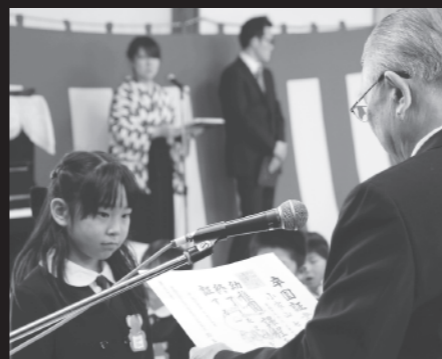
園長先生から卒園証書が(3/24摩周丘幼稚園)