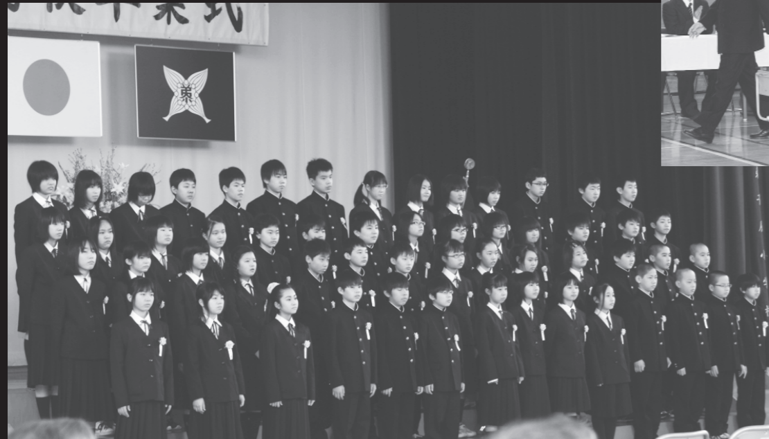
未来へ羽ばたく57人の卒業生たち(3/19弟子屈小学校)