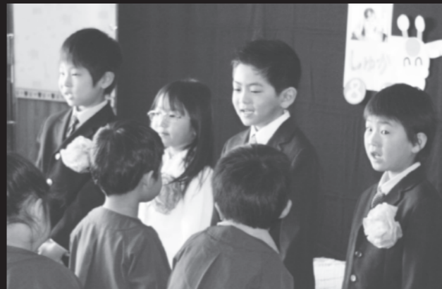
4人の卒園児が在園児と「呼びかけ」でお別れ(3/24奥春別森野保育園)