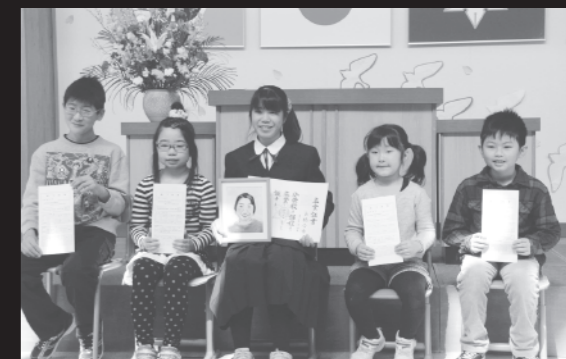
唯一の卒業生が在校生と記念撮影(3/23昭栄小学校)