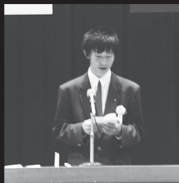
卒業生代表が答辞を贈る(3/1弟子屈高校)