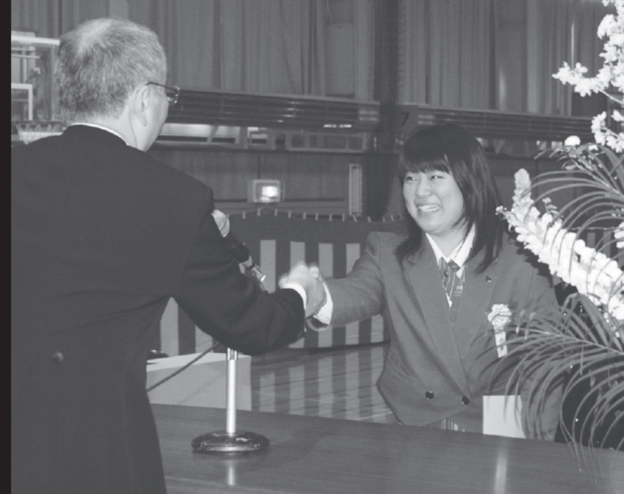
卒業証書を受け取り校長先生と笑顔で握手(3/1弟子屈高校)