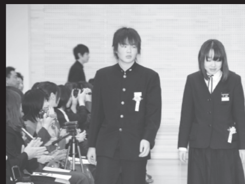
たくさんの拍手に迎えられて入場(3/15弟子屈中学校)