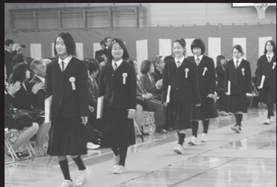
在校生や保護者などの温かい拍手に送られて退場(3/19弟子屈小学校)