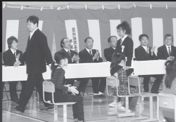
たった一人の卒業生が涙で退場(3/23和琴小学校)