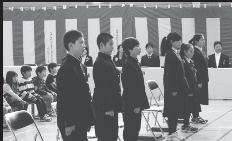
6人が新たな旅立ちを迎える(3/19川湯小学校)