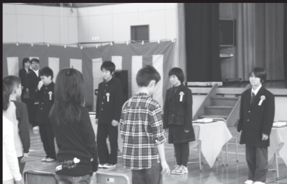
在校生から温かい言葉を贈られる4人の卒業生(3/23奥春別小学校)