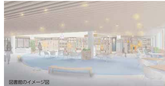
図書館のイメージ図

先月号からお知らせしています旧宮林署跡地に整備する複合型地域観光交流拠点施設(図書館・プール・温浴・カフェなど)の基本設計の概要を、数回にわたって紙面でお知らせします。