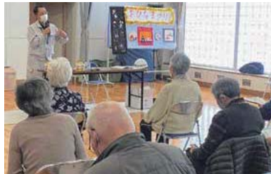
泉ふれあいセンターでの防災講話

問い合わせ先／役場総務課防災情報係 ☎ 4 8 2 - 2 9 1 2 (課直通)