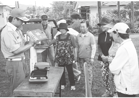
AEDの操作方法に聴き入る参加者