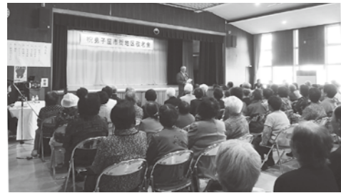
市街地区敬老会の様子