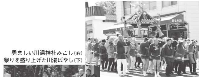
勇ましい川湯社みこし(右) 祭りを盛り上げた川湯ばやし(下)