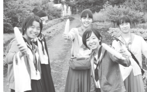
自分でもいだトウモロコシに笑顔

9月15日の敬老の日にならみ、長年の社会貢献と長寿を祝う敬老会が、町内各地で開催されました。