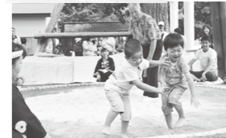
元気いっぱいの子ども相撲

8月27日から29日には、川湯神社例大祭が行われました。28日に行われたみこし行列では、本みこしや子どもみこしが威勢のよい掛け声とともに練り歩きました。また同日、川湯神社境内で奉納相撲大会が行われ、川湯の保育園児・児童が熱戦を展開。訪れた保護者などから盛んに声援が送られていました。