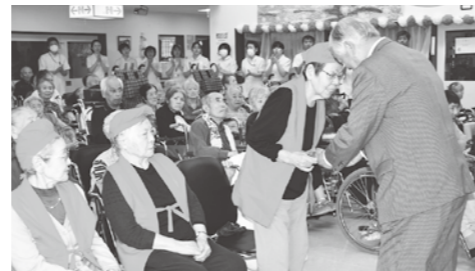
祝い品の贈呈(倅和園・摩周の合同敬老会)

9月15日の敬老の日にならみ、長年の社会貢献と長寿を祝う敬老会が、町内各地で開催されました。