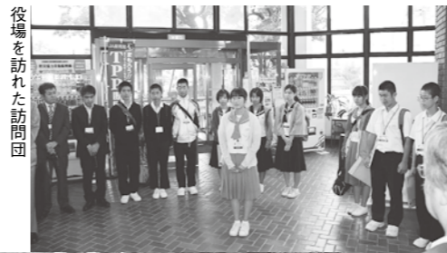
役場を訪れた訪問団