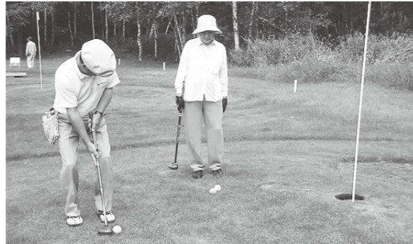
真剣勝負ながら和気あいあいと

会の活動周知と、地域の方の防火意識の向上を目的に毎年開催されています。競技の合間に行われた消火器の使用方やAED(自動体外式除細動器)の操作方法についての説明では、多くの質問が出るなど積極的な様子が見られ、参加者の防火意識が高まりました。