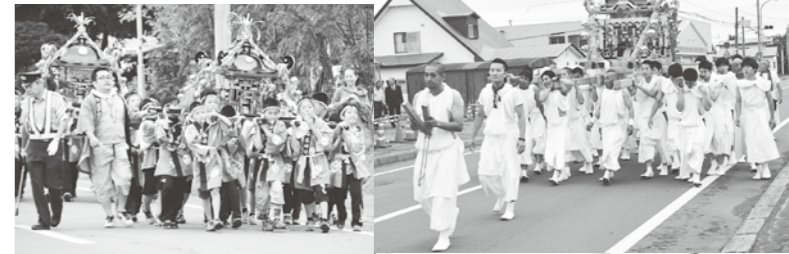
活気あふれる弟子屈社みこし(右上) 子どもみこしも元気にパレード(上) たくさんの観客の前で 鎧獅子舞を披露(右)