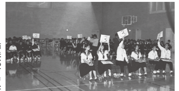
弟子屈町と日置市に関するクイズで盛り上がる 弟子屈・東市来両中学校の生徒たち

本町の姉妹都市である鹿児島県日置市の中学生姉妹都市交流派遣団14人が、8月25日(土)～28日(月)の日程で本町を訪れました。25日には役場を表敬訪問し、町職員などの出迎えを受けました。