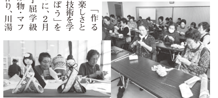
川湯学級のおひなさま作り(左)と弟子屈学級のマフラー作り(右)

「作る楽しさと技術を学ぼう」をテーマに、2月は弟子屈学級で編み物・マフラー作り、川湯学級はクラフト・工芸・おひなさま作りをそれぞれ学びました。出来上がるまでの過程を楽しみながら、一つ一つ丁寧に仕上げました。