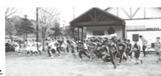
昨年の大会の様子

▼期日/10月12日(月) 体 育の日 ●受け付け/8時45分～ ●開会式/湯の島寿の家 前 9時30分 ●競技開始/10時 ▼コース/市街地釧路川沿線 ●らくらくコース(1キ) ●ほのぼのコース(3キ) ●さわやかコース(5キ) ▼参加資格/小学校1年生以上の町民の方。(家族で参加するお子さんに限り3歳以上) ▼参加料/無料 □申し込み・問い合わせ先/町教育委員会社会教育課体育振興係 ☎482・2948(課直通)まで。