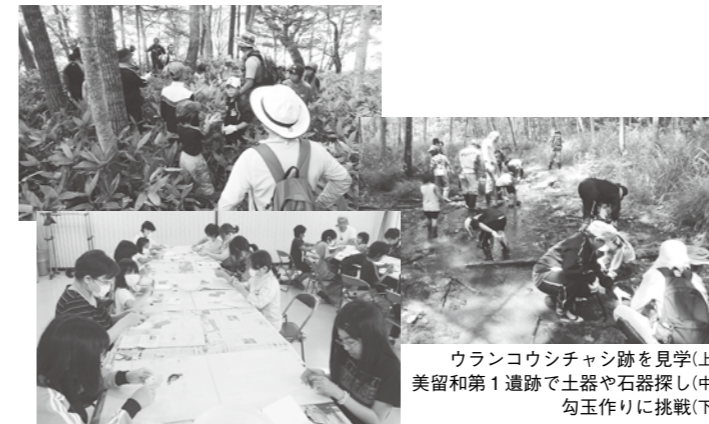
ウランコウシチャシ跡を見学(上) 美留和第一遺跡で土器や石器探し(中) 勾玉作りに挑戦(下)

夏休み子ども体験事業「古代に土器！土器！」を7月31日に行いました。参加者は町内の児童14人を含む24人。今年3月に「釧路川流域チャシ跡群」として国史跡に指定された「ウランコウシチャシ跡」を見学した後、埋蔵文化財包蔵地である美留和第一遺跡を見学し、土器や石器を探しました。多くの参加者が、土器片などを発見。勾玉(まがたま)の製作体験も行い、参加者の皆さんは熱心に石を磨いて、自分だけの勾玉を作っていました。