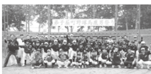
町内の野球を盛り上げよう

ベキューなどで交流しました。また、バーベキューの収益金15万7千100円から弟子屈高校野球部に12万1000円、弟子屈中学校野球部に3万円、摩周ジャガーズに7千円を寄附しました。大道代表は「今後も継続していきたい」と話していました。