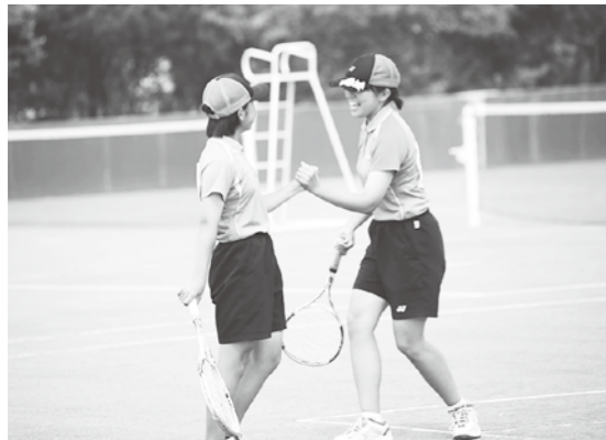
全道大会に出場した弟子屈中学校テニス部