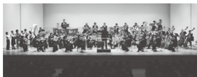
多くの聴衆を魅了した札幌の演奏