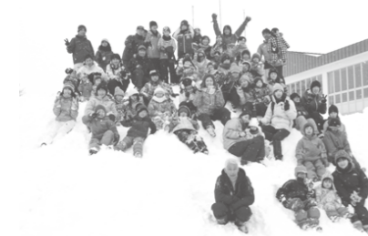
みんなで楽しむやんちゃウインターフェスティバル

町内にも降雪が見られ、いよいよ冬本番が近づいてきたことを実感させられます。暗くなるのが早くなり、夕方になると、歩道を歩く子どもたちの姿が見えにくくなります。さらに、雪が降ると道路が凍り、道幅も狭くなるため、通学時の危険が増えます。私たちも、子どもたちに交通マナーを徹底させることの必要性をあらためて感じています。 皆さんも、些細(ささい)なことでも構いませんので、お気づきの点がありましたら、下記までご意見をいただくと幸いです。