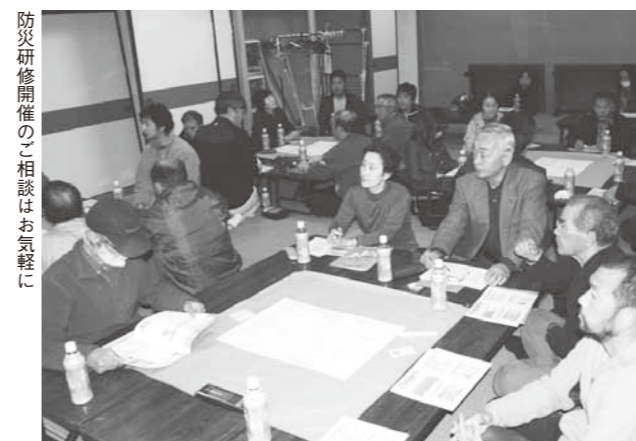
防災研修開催のご相談はお気軽に