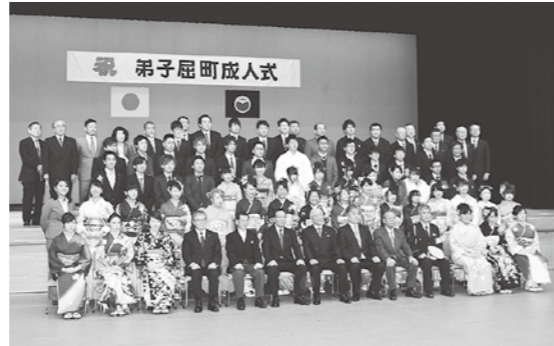
出席者全員で記念撮影