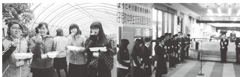
観光農園でのイチゴ狩り