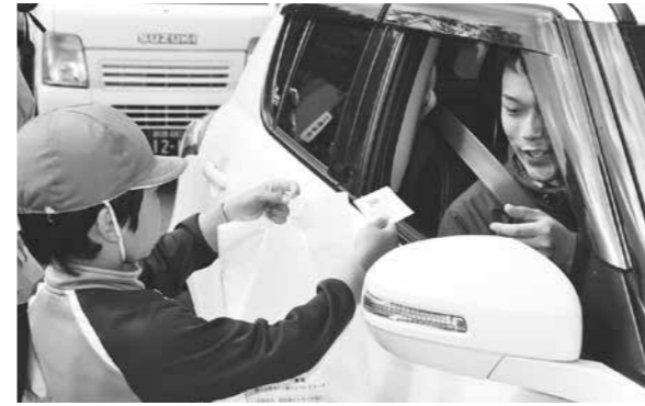
ドライバーに手作りのしおりを手渡す奥春別小学校の児童

と奥春別小学校の児童19人が参加。旗を片手に行き交うドライバーに交通安全を呼びかけたほか、啓発品を手渡しして安全運転を促しました。