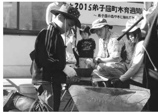
木育プログラムでは火おこしにも挑戦

木育プログラムでは火おこしにも挑戦が参加しました。午前中、川湯地区の国有林で、林業の仕事を見学。午後からは林業多目的センターに移動し、木の枝を使ったカスターネット作りや、草木染め、火おこしなど、さまざまな体験を楽しみました。