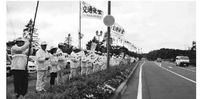
旗の波で交通安全を呼び掛ける明盛建設の皆さん