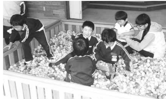
木の砂場で遊ぶ子どもたち

木育プログラムでは火おこしにも挑戦が参加しました。午前中、川湯地区の国有林で、林業の仕事を見学。午後からは林業多目的センターに移動し、木の枝を使ったカスターネット作りや、草木染め、火おこしなど、さまざまな体験を楽しみました。