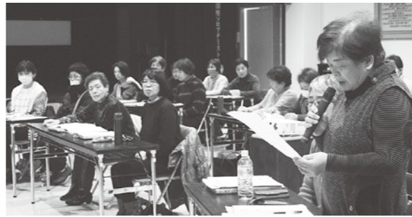
活発に意見交換が行われた健康づくり推進委員による検討会議

この会議は、21計画をスタートした今年度、初めて開催したもので、28年にわたる健康づくり推進委員の活動の歴史においても初めてのことです。