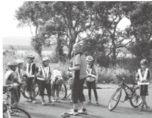
未来子ども協議会が行う体験活動が子どもたちの糧になるように

● 友人関係や対人関係が希薄で、異年齢や異世代との交流が少ない。 ● 失敗を恐れ、自分自身で決定することをしない。 ● 体験不足で、学習などの意欲が低下している。 ● 自己肯定感が低下している。 子どもたちが抱える課題を解決し、大きくたくましく成長した先に