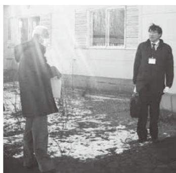
今年度、滞納整理機構が実施した搜索の様子