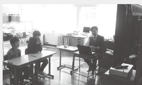
和琴小学校での租税教室