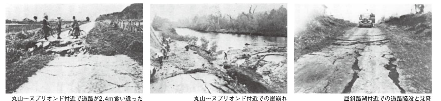
丸山～ヌプリオンド付近で道路が2.4m食い違った 丸山～ヌプリオンド付近での崖崩れ 屈斜路湖付近での道路陥没と沈降