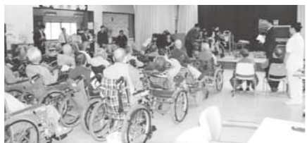
倅和園・特養摩周の入居状況は

答 福祉こども課が受付窓口となり、3カ月に1回、入所判定会議を開いて順番を決定し、順次入居している。現在、倅和園で6人、特別養護老人ホーム摩周で100人程度の待機者がいる。