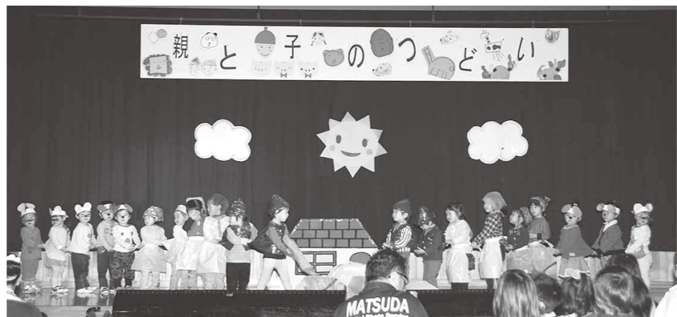
より良い保育園の在り方を検討

問 機構改革により職員の異動もあり、体制が変わり1年が過ぎようとしているが、事業の進み具合はどうだったか。また、職員間のコミュニケーションはとれていたか 答 町長答弁 町民の皆さまに使い勝手の良い組織となることを念頭に「課の編成および名称の変更」と「機構改革の重点目標」を定め、職員が一丸となって町政に取り組み体制を整備した。職員数も163人と少ない人数の中で、いかに効率的な事務、事業を進めていくかという点においても、各職員がそれぞれの立場で責任と自覚を持って取り進める必要があり、各課長を中心に業務の課題、進捗よく状況を含め、課内での連携やコミュニケーションを高めながら日々取り組んでいる。今後においても町民の皆さまに使い勝手の良い組織となることを前提とし、見直しが必要なものについては随時検討しながら取り進めていきたいと考えている