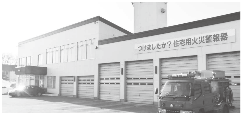
消防庁舎移転に向けての協議は

町長答弁 弟子屈消防庁舎は、建設されてから33年が経過し、接している町道の交差点が変則なことから交通安全上の問題も指摘されている。そのため、当該交差点から野球場の交差点までを町道から道道に移管して道路改良を実施するため北海道と協議しているところで、情報では事業採択後、道路の支障となる消防庁舎の移転は、早ければ平成28年度に行うこととなる。