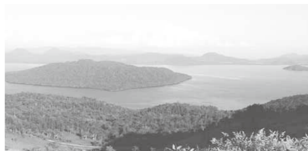
恵まれた自選環境を保全・活用したジオパークを目指しては

問 保育所、幼稚園について 弟子屈町子ども子育て支援事業計画により示す 問 5年前から合併民営化の検討を進めてきたが、奥春別荘の保育園のみで前進していない。弟子屈における子どもたちの人数が大きく減少している現状では、今までの方向を180度転換し、町が主体となつて現在国と道が進めている「事業所内保育に地域枠」による各企業の小規模保育の制度もあることから、保育士の待遇改善を図り、子どもたちを育てやすい町となるような政策に予算を投ずるよう進めるべきと思うが、所見を伺う。 答 町長答弁 保育園の在り方について法人化などの検討も行ってきたが、国の制度改正を見極めた上で検討することとし、第6次の行革において「子ども・子育て会議」の子育て環境や支援全般に関する検討結果を見極めた上で結論を出したい。今回の制度改正は、家庭的保育や事業所内保育などを「地域型保育給付」とし、町の認可事業として利用者が選択できる仕組みで、待機児童の解消を図るもので、国では、平成27年度をめどに施行を想定している。町としては「子育て支援に関するニーズ調査」の結果や、保護者・子育て支援に関わる人たちの意向や要望を十分に聞き、子育て支援の方向性について、平成26年度に策定する「弟子屈町子ども・子育て支援事業計画」により示したい。