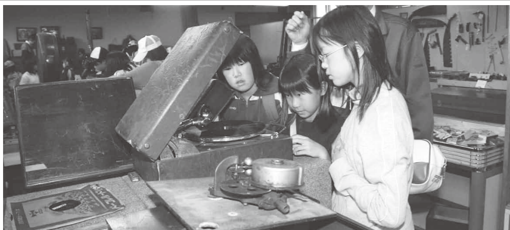
郷土資料のより効果的な補完と活用を