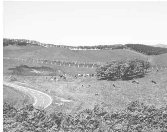
牛馬が放牧される町営牧場

◎弟子屈町墓地条例の一部を改正する条例の制定について(議案第9号) 弟子屈墓地において、平成25年度から新たに供用開始となった地番および過去の追加漏れの地番の提案と、これまで一人の名義で1区画の使用とされていたものを、2区画まで使用可能とする改正。