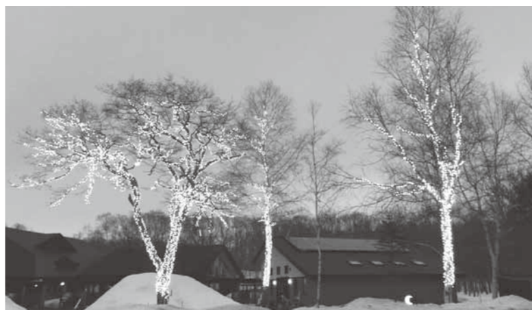
温泉発電を活用した観光振興の検討を

現在、道の駅敷地内に温泉を活用したイルミネーション白色発光ダイオード(LED)が1万個設置されている。省エネルギーミネーションを規模拡大し、温泉熱活用省エネルギーリサイクル発電の宣伝と合わせた観光客誘致拡大を考えられないか。温泉熱発電活用の方向性を