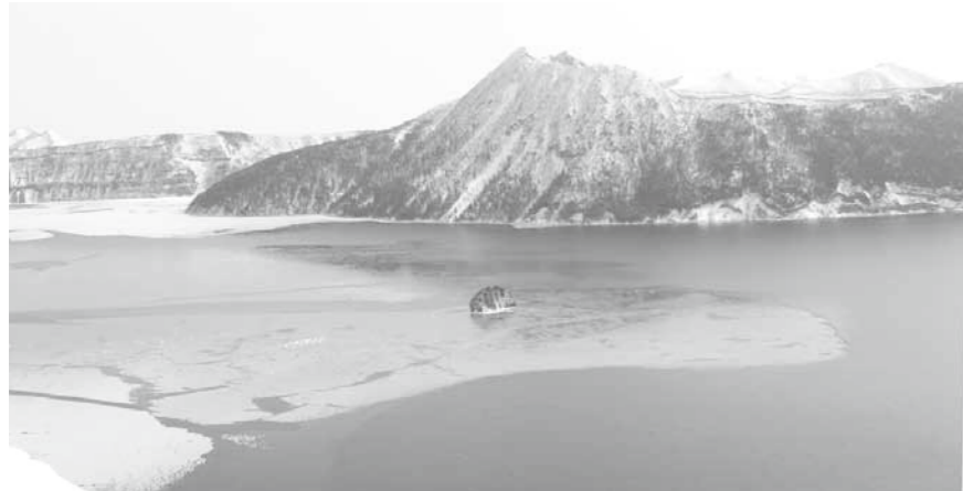
国立公園の名称変更の際には摩周湖・屈斜路湖を含めて

問 国立公園指定80周年に向けて 阿寒・摩周・屈斜路国立公園に 問 ▼1点目／本年阿寒国立公園指定80周年を迎えるが、具体的にどのような記念事業が検討されているか伺う。 ▼2点目／阿寒観光協会まちづくり推進機構は、阿寒国立公園指定80周年を契機に「阿寒・摩周国立公園」に名称変更するよう関係団体に提