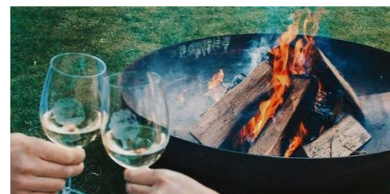
『散歩道の先にある焚火 BAR 広場』 静かな森に佇む広場で焚火を囲いドリンクを楽しめる。程良い賑わい生まれる。