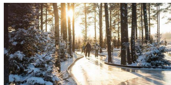
『自然で形成されたスケートコース』 冬は遊歩道がスケートリンクとなり、季節ごとの方法で森を楽しむコンテンツとなる。