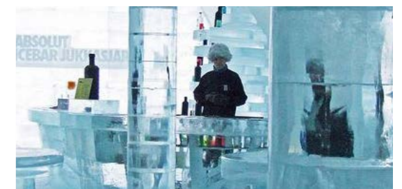
『冬の森を楽しむアイス BAR』 季節限定の、冬の森の中に築かれた氷の建築が旅の目的の一つとなる。

他 ... マウンテンバイク、ジップライン、フィールドアスレチック、アイスバー、ナイトミュージアム