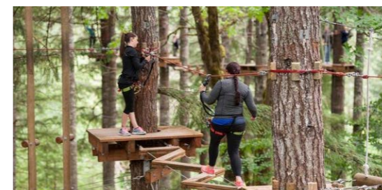
『遊び空間を通して本物の森を体感する』 森のアスレチックを通してより自然を身近に感じ、興味を持つきっかけとなる。